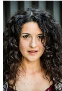
Mireia Aixelà Actriu