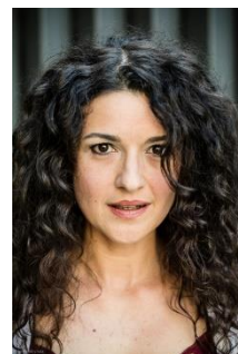
Mireia Aixelà Actriz