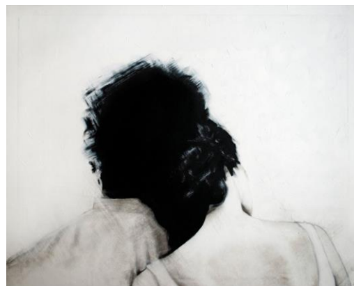
Sincronitzats , 2017